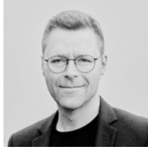
Flemming Birch Birch & Birch